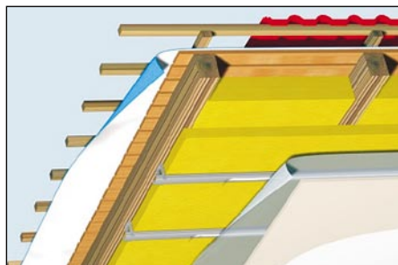
Polno izoliran špirovec z dodatno izolacijo

S tem, ko v konstrukcijo vgradimo toplotno izolacijo želimo doseči, da bodo pozimi notranji prostori toplejši od zunanjega zraka ter poleti prijetno hladni za bivanje. Tako imamo v zaprtih prostorih, predvsem jeseni, pozimi in spomladi, toplejši zrak, ki pa je sposoben sprejeti tudi več vlage od zunanjega zraka. Samo za predstavlo povejmo, da odrasla oseba v enem dnevu proizvede okoli 2 l vode v obliki vodne pare. Zmema količina vodne pare v zraku ni problem, odvečne vlage pa se lahko znebimo s prezračevanjem. Problem pa nastane kadar imamo v prostoru hladnejše površine (okna, neizolirane stene), na katerih vodna para kondenzira.